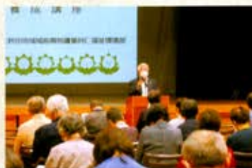
心はればれゲートキーパー養成講座