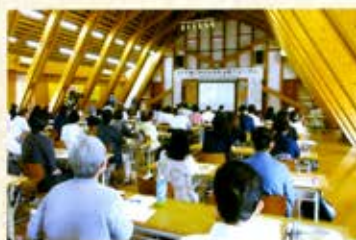
若者支援フォーラム