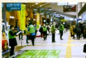
街頭キャンペーン