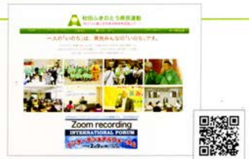
▲秋田ふきのとう県民運動のホームページです